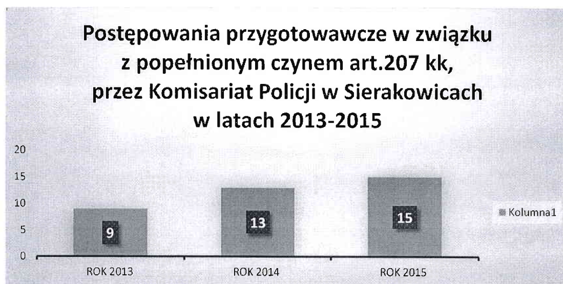
Wykres nr 2

Wykres nr 2 obrazuje ilość prowadzonych postępowań przygotowawczych w związku z popełnionym czynem art.207 kk.