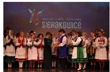
Fot. z 45-lecia Kaszubskiego Zespołu Pieśni i Tańca Sierakowice - E.C.