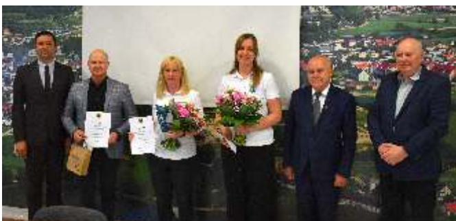
Tekst i fot. EC