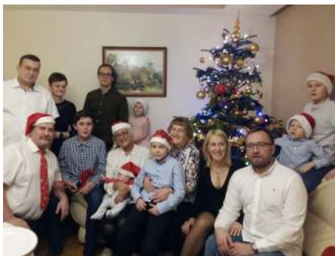
Wigilia z ukochaną rodziną - z dziećmi, wnukami i prawnukami

Pełniła również funkcję ławnika ludowego w Sądzie Rejonowym w Kościerzynie, była produkującym działaczem Ruchu Spółdzielczego. Śpiewała w chórach: przez kilkadziesiąt lat w chórze przy parafii św. Marcina w Sierakowicach, a potem w chórze w Kartuskim Klubie Seniora. Po przejściu na emeryturę nie zwolniła tempa życia. Była studentką Uniwersytetu Trzeciego Wieku, a także uczestniczką wielu parafialnych grup. Zawsze pogodna, życzliwa i pełna życia, nawet w podeszłym wieku pozostawała aktywna, do końca interesowała się światem i ludźmi wokół.